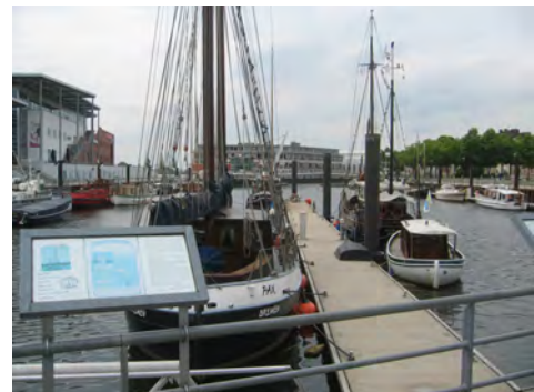
Hafen von Vegesack