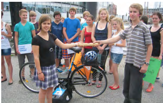
Übergabe des Staffelholzes