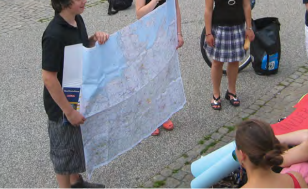
Vorstellen der Strecke auf der großen Niedersachsenkarte