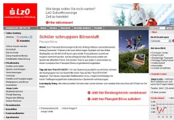
Homepage zum Planspiel Börse

Planspiels werden von den Schülerinnen und Schülern in einer von der LzO verwalteten Onlineumgebung durchgeführt.