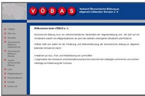
Homepage des Verbands VOEBAS