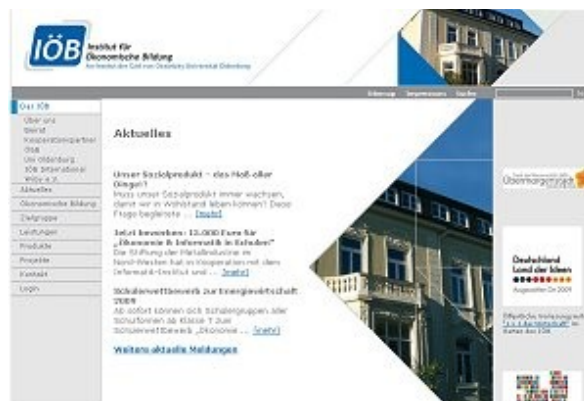
Homepage des Instituts für Ökonomische Bildung

Die Zusammenarbeit mit der Universität Oldenburg und hier im Besonderen mit dem Institut für ökonomische Bildung ist seit langem gut etabliert. Verschiedentlich wurden aus dem Fachkollegium Wirtschaftslehre der Cäcilien Schule in den vergangenen Jahren Lehraufträge an der Universität Oldenburg im Rahmen der Lehrerausbildung im Fach Ökonomie wahrgenommen.