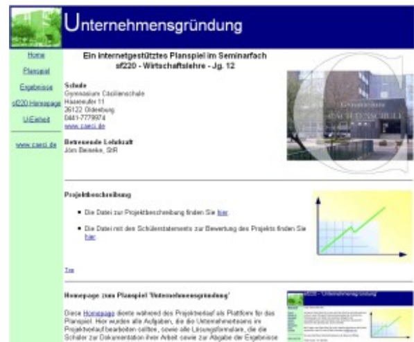
CD-Rom zum Planspiel Unternehmensgründung

Das internetgestützte Planspiel zur Unternehmensgründung wird regelmäßig in den Kursen Wirtschaftslehre bzw. den Seminarfächern 'Allgemeine Wirtschaftslehre' als Angebot für die Schülerinnen und Schüler der Sek. II durchgeführt.