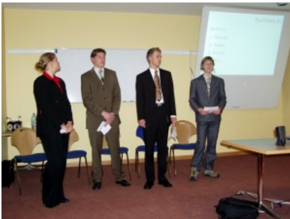
Präsentationsabend beim MIG

Seit zehn Jahren richtet die Cäcilien-schule getragen von den Fachbereichen Politik/Wirtschaft und Wirtschaftslehre das Management Information Game (MIG) in Kooperation mit dem Bildungswerk der Niedersächsischen Wirtschaft (BNW) sowie der EWE AG aus. Durchgeführt wird das MIG jeweils im Jahrgang 11 bzw. jetzt in Jahrgang 10 jeweils im Januar im Ausbildungsdorf der EWE AG.