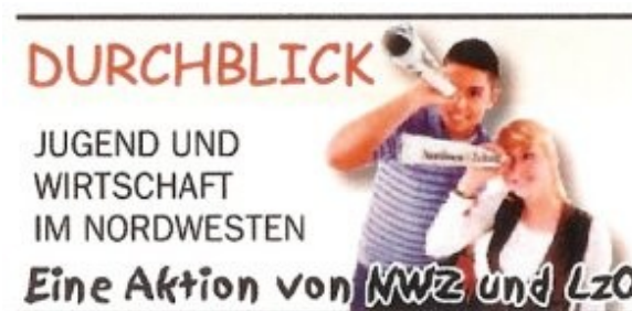
Logo zum Projekt Durchblick

Das aktuell laufende Seminarfach 'Allgemeine Wirtschaftslehre' 2009-2011 nimmt teil an dem Projekt 'Durchblick – Jugend und Wirtschaft im Nordwesten'. Dieses erstmalig in dieser Form durchgeführte Projekt wird neben den teilnehmenden Schulen betreut und getragen von der NWZ, der LzO sowie dem IZOP aus Aachen als begleitendem wissenschaftlichen Institut.