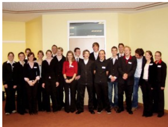
Gruppenbild nach erfolgreicher MIG-Präsentation

die Schülerinnen und Schüler in jeder Spielrunde eine umfangreiche Kalkulation ihrer Geschäftszahlen, die jeweils am Ende eines Tages vom Spielleiter ausgewertet wird und die die Basis bilden für die erfolgreiche Unternehmensführung. Vor jeder neuen Spielrunde erfolgt die Präsentation der im vorigen Geschäftsjahr getroffenen Entscheidung sowie der auf diesen Entscheidungen basierenden Ergebnisse. Ergänzend zu den einzelnen Spielrunden erhalten die Unternehmerteams die Aufgabe, eine Marketingpräsentation für das zu Beginn des MIG gemeinsam festgelegte Produkt zu erstellen. Die Präsentationen finden dann jeweils am Donnerstagabend vor einer geladenen Öffentlichkeit bestehend aus Schul- und Unternehmensvertretern statt. Am Freitag erfolgt dann die Präsentation der Geschäftszahlen aus allen vier Geschäftsjahren in Form einer Hauptversammlung. Diese Hauptversammlung stellt gleichsam den Abschluss des MIG dar.