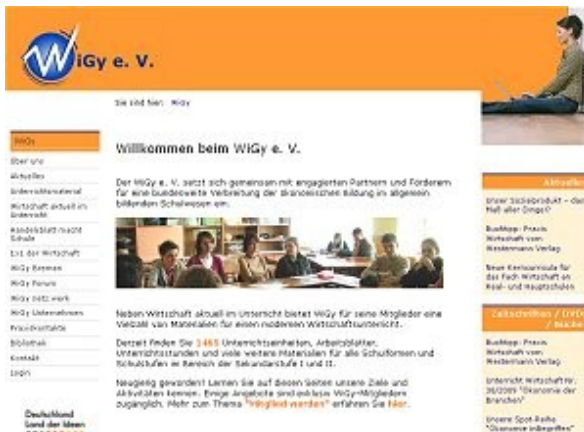
Homepage des WIGY e.V.