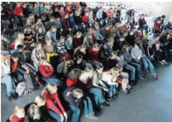
Lesewettbewerb in der Aula

Ein besonderes pädagogisches Angebot bietet für musisch begabte Kinder unser Musikzweig für die Jahrgänge 6 bis 9. Unsere bisherige Zusammenarbeit mit der Musikschule der Stadt Oldenburg ordnet sich hier ein. Die zusätzliche Entscheidung für die Studentafel 1 mit ihrer Möglichkeit eines Wahlpflichtbereiches für Schülerinnen und Schüler führt diesen Gedanken des differenzierten Angebotes in der Mittelstufe weiter; wir wollen damit die Möglichkeiten der eigenverantwortlichen Schule für die Interessen und Begabungen unserer Schülerinnen und Schüler aufgreifen. In den Jahrgängen 7 bis 9 können so in einem Wahlpflichtbereich eine dritte Neue Sprache erlernt oder Naturwissenschaften begabungsgerecht vertieft werden. In den Naturwissenschaften wirkt sich besonders aus, dass die Cäcilien-schule schon sehr früh als n21-Medien-schwerpunktschule anerkannt und gefördert wurde und einen besonders gut ausgestatteten IT-Bereich besitzt. – Eine klar strukturierte Oberstufe mit eindeutigen Profilvorgaben führt die in der Mittelstufe gelegten Grundlagen differenziert fort.