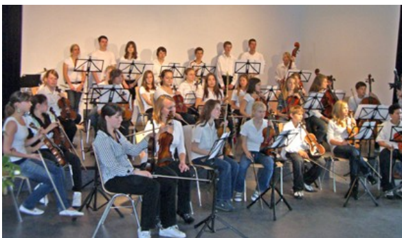
Das Orchester der Cäcilien- schule