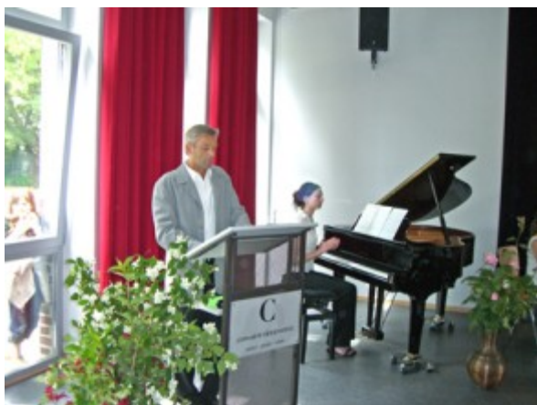
Einweihung des neuen Musikraums

Ein der Cäcilien-schule wichtiger übergeordneter Begriff ist „Freude am Leben“. Diese ist ein immanentes Ziel aller zu vollbringenden Anstrengungen.