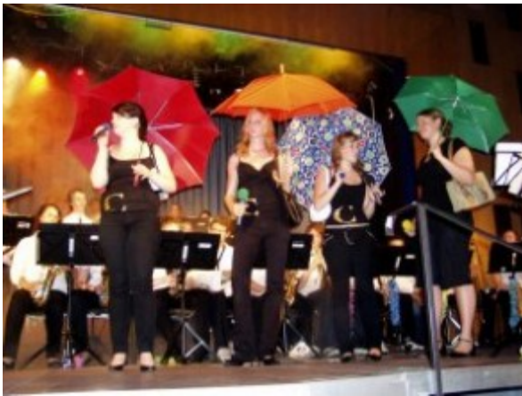
Cäci-BigBand in der Aula