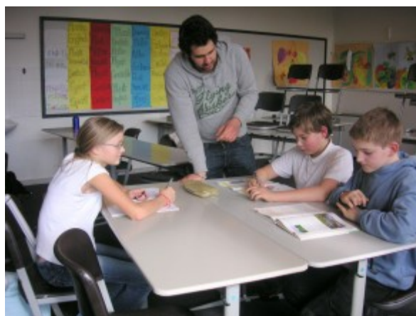
Projekt Schüler helfen Schülern

Über den unesco-Gedanken streben wir auch die unterrichtliche Auseinandersetzung mit Lebenswirklichkeiten in anderen Ländern an. Dies bedingt für uns andererseits auch die Förderung einer eigenen Inter-nationalität. So begrüßen wir gern Schüler aus dem Ausland und suchen Gastfamilien bei unseren Eltern, fördern den einjährigen Auslandsaufenthalt unserer Schülerinnen und Schüler durch Informationsabende und fördern Reisegedanken durch Stipendienvereinbarungen mit High Schools in Minnesota und Michigan, USA, organisieren den mehrwöchigen Schüleraustausch mit Frankreich, den USA und Russland, beteiligen wir uns federführend regelmäßig an der OLMUN. Die Einbindung von Fremdsprachen-assistenten, die Durchführung von zusätzlichen Französisch-Prüfungen als DELF, und ein in der Planung befindliches Comenius-Vorhaben wird in besonderer Weise fächerverbindendes Lernen und Austausch der Ergebnisse mit internationalen Partnerschulen verknüpfen. Neue Portfolio-Versuche zeigen den Fachzusammenhang mit dem Fremdsprachenunterricht.