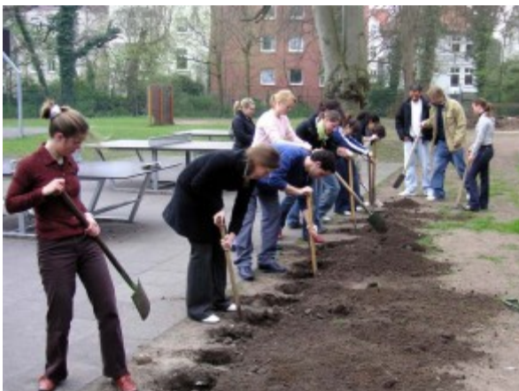
Pflanzaktion auf dem Dobbenhof