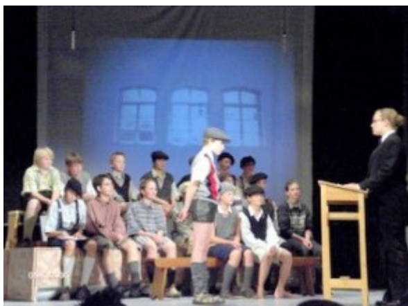
Theateraufführung in der Aula

Unser „Verein der Freunde der Cäcilien- schule“ gibt Gelegenheit zur fördernden Identifikation mit der Cäcilien- schule über den Schulalltag und über das Schülerda- sein hinaus.